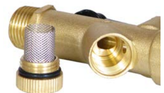
Combo-ventiel met geïntegreerd vuilzefje

JORC is NEN - EN - ISO 9001:2015 gecertificeerd