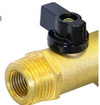
Dubbele inlaataansluiting 1/2" & 1/4"